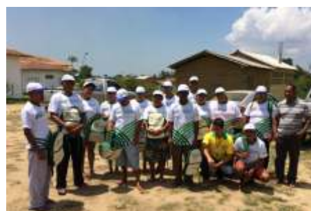
Lançamento do Pronatec