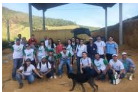
1ª turma do Rede eTec – Polo de Rio Bananal.