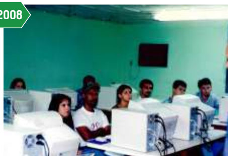
Curso de informática para secretários dos sindicatos rurais – Calir, em Viana