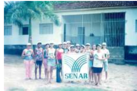
Treinamento de olericultura Barra de São Francisco