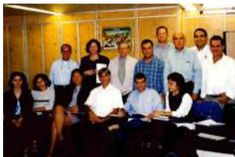
Reunião de técnicos das Administrações Regionais do Senar – Brasília

1º de agosto Inauguração da nova sede do Senar na Reta da Penha.