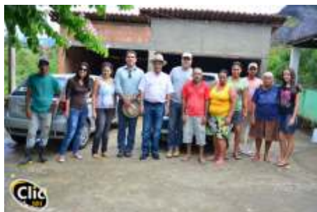
Lançamento do Programa de Assistência Técnica e Gerencial