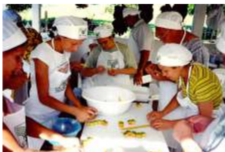
Treinamento de conservas vegetais