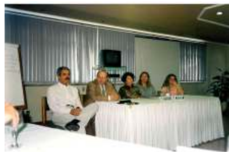
Evento com todos os superintendentes do Brasil – no hotel Porto do Sol, em Vitória.