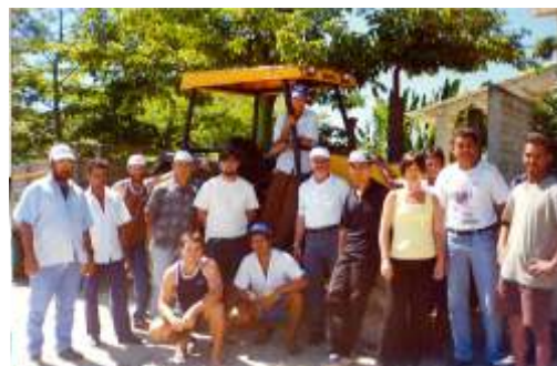
Treinamento de tratorista Boa Esperança