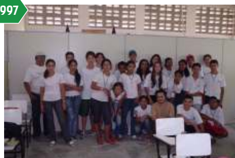
1ª turma de Aprendizagem Rural do Brasil