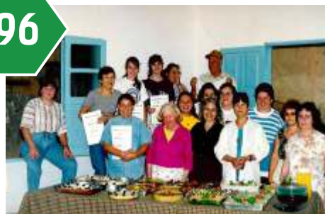
Treinamento de Culinária de tortas doces e salgadas