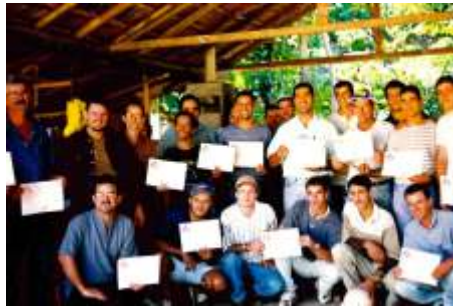
CCR (Curso de Capacitação Rural) – Parceria Sebrae-ES e Senar-ES. Preparou o agronegócio do estado na gestão das propriedades rurais.