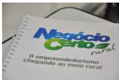
Lançamento do programa Negócio Certo Rural

Programa Novas Lideranças Identificação de novos líderes para o meio rural, fortalecendo assim os Sindicatos Rurais.