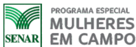
Programa Com licença vou a luta torna-se Mulheres em Campo