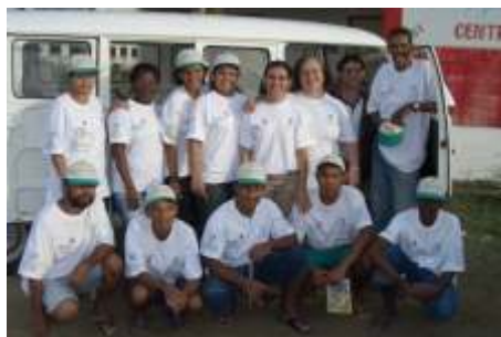
Lançamento do programa Apoena