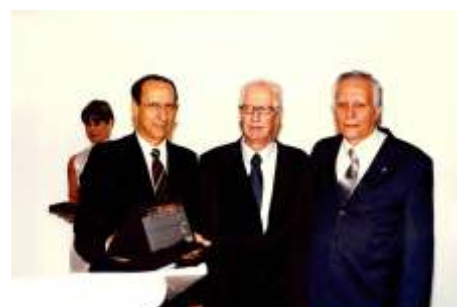
Evento de 10 anos do Senar