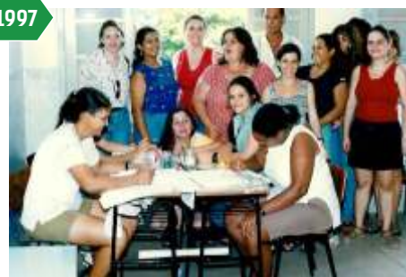
Treinamento de Pintura em Tecido - Patrimônio do XV, Nova Venécia