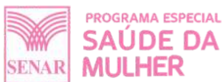
Programa Útero é vida mudou para Saúde da Mulher.