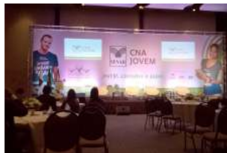
Lançamento do programa CNA Jovem