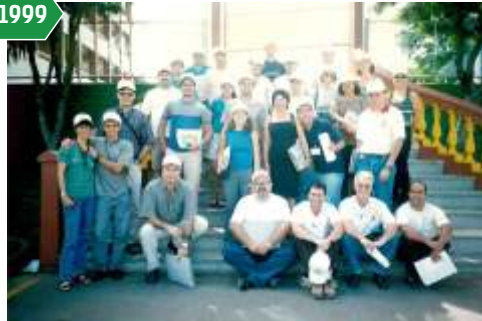
Treinamento de metodologia da Formação Profissional e Promoção Social voltado para instrutores