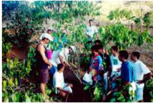
Treinamento de manejo da lavoura de café Barra de São Francisco