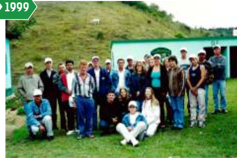
Curso de Administração de Associações Rurais realizado em Garrafão, Santa Maria de Jetibá