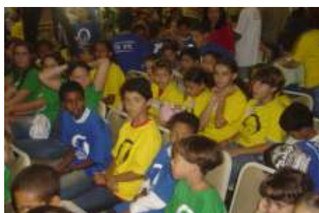
Lançamento do programa Agrinho 21 prêmios / 10.000 alunos / 7 municípios